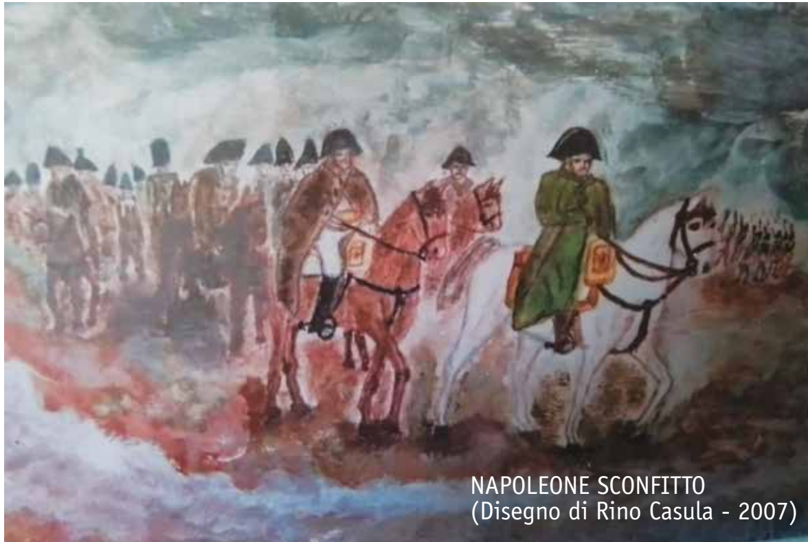
NAPOLEONE SCONFITTO

Pensate quanta vanità lo assillava: fece prigioniero il Papa Pio VII, lo tenne per tre anni; lo costrinse a incoronarlo Imperatore, ma poi la corona gliela tolse dalle mani e se la pose sul capo da solo, a significare la sua superiorità rispetto al potere della Chiesa. Bramava avere Josephine, la moglie, nella sua tenda da campo e lei, che intanto nella reggia non aveva problemi di sorta, lo faceva sospirare pri-